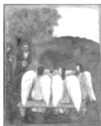
Titelbild: Marc Chagall „Drei Engel besuchen Abraham“